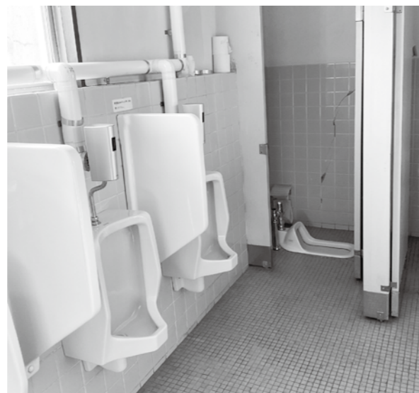
老朽化した役場庁舎トイレ