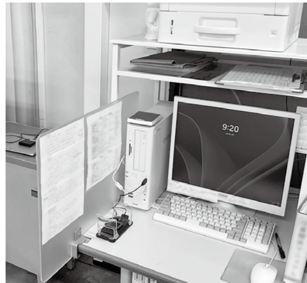
町民にスムーズに対応するシステムを増設予定

住民税務課長 現在窓口では、マイナンバーカードの更新作業を1台で行っていますが、もう1台増設して利便性を上げる事業に対する国からの補助金です。