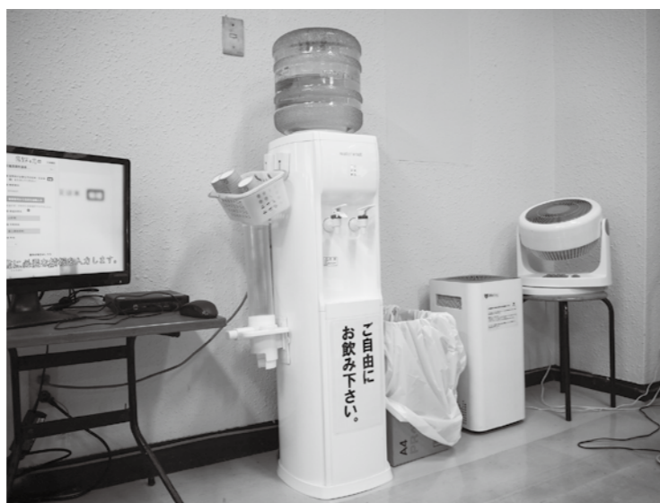
庁舎ロビーに設置された(温・冷)ウォーターサーバー

住民税務課長 昨年の8月に「災害時における飲料水の提供」に関する協定を民間企業と締結しました。災害時にウォーターサーバーを10台と水12ℓ入り100本が供給されます。現在は庁舎ロビーに1台設置して利用しております。予算の1万5千円については、その1台分の令和6年度の利料になります。