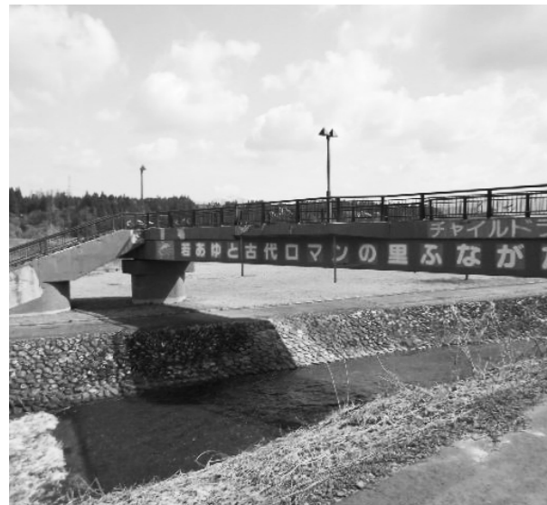
塗装で修繕されるチャイルドランド歩道橋

地域強化対策室長 チャイルドランドの歩道橋の塗装と、あゆ型水路の土砂等を掃除するための水路を新設する工事です。