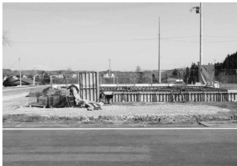
住宅建設が進む堀内分譲地（旧堀内小跡地）