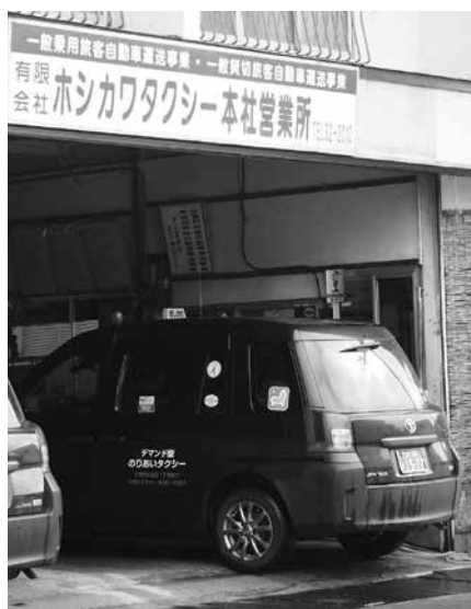
舟形駅からの発着を3便追加

まちづくり課長 県立新庄病院までの町外便の午後の便を追加したことにより、利用者数が増加したため、補助金の増額になります。