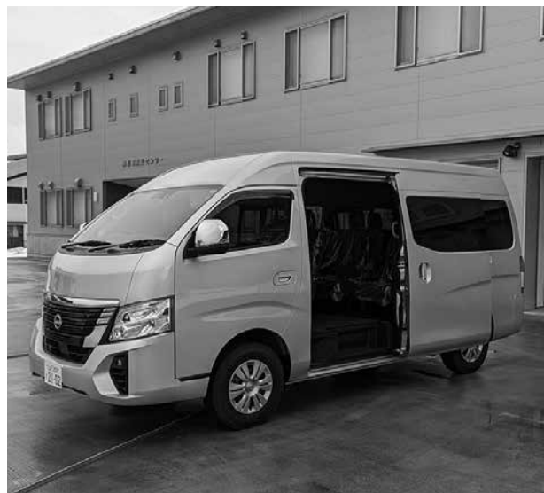
14人乗りキャラバンマイクロバス