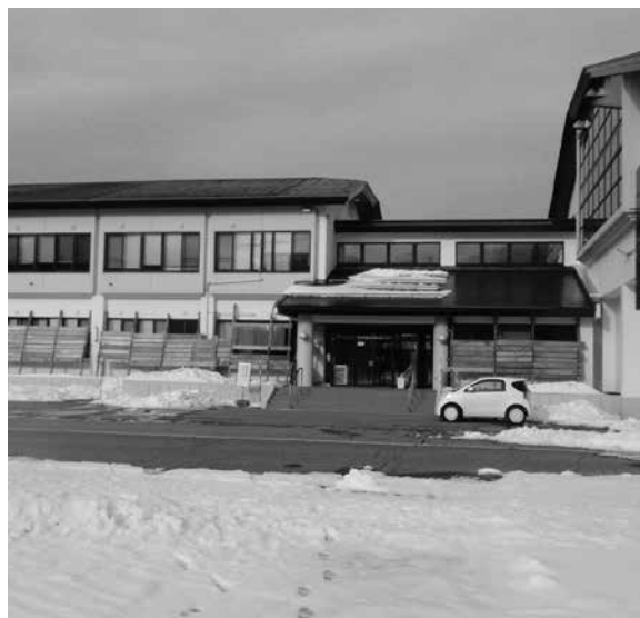
工事が完成した農村環境改善センター

まちづくり課長 屋根の破風で100万円、外壁の窓枠で300万円、玄関の階段部分が200万円。キュービクルの配線等が主な内容になっており、総額689万円の追加となっております。