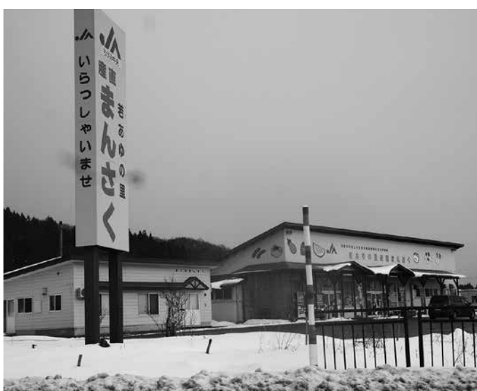
平成13年にオープンした若あゆの里 産直まんさく

町長 農協組合長との懇談の場で、農協の方向性をお聞きしましたが、産直施設まんさくは町にとって重要な位置付けとして認識していますので、会員のみなさまの意向も踏まえて、存続していただきたい旨を農協に伝えてまいります。