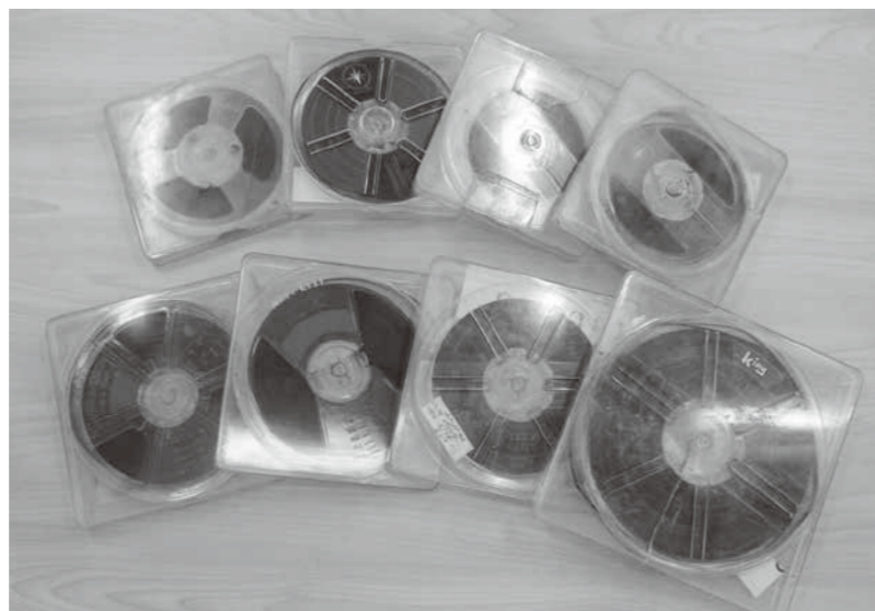
大切に保管されていた懐かしい8ミリフィルム!!

財政主査 サマージャンボ宝くじとハロウィンジャンボ宝くじが、各市町村に分割して交付されています。交付額は令和3年度に約450万円、令和4年度に約430万円となっており、実績に鑑みて令和5年度は400万円を計上しました。