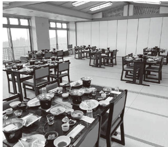
改修された大広間の利用拡大を目指す