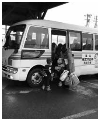
安全装置が取り付けられる保育園送迎バス

教育課長 保育園専用送迎バス1台と、スクールバスと併用する車両3台の計4台に設置予定で、取り付け料を含んだ金額です。