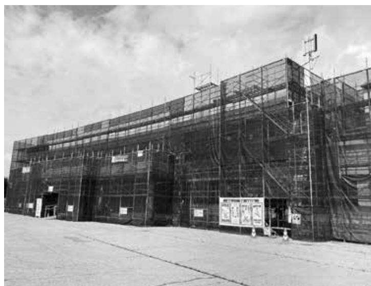
改修中の生涯学習センターのようす

地域整備課長 現在の空き家は114軒、内危険空き家は25軒あります。進捗状況は令和3年度まで66軒、今年度は9軒を解体し、今回の補正分で住宅2軒、小屋1軒を解体するための補助金が申請される予定です。危険空き家は今回1軒解体されるので、残り24軒です。