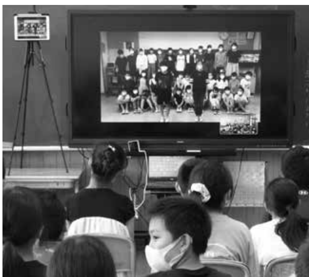
リモートで情報交換し進められた児童交流

まちづくり課長 当初の設計段階では確認が出来ず、工事を進めてから不具合箇所が発見されました。今後も工事に入ってから変更が発生することもあるかと思いますが、事前調査、現場の実情を十分確認し、設計の精度の向上を図るよう努めてまいります。