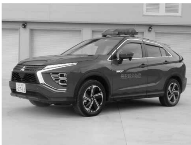
1500W発電可能な町本部指揮車

出産支援給付金は、現在出産一時金が支払われていますが、出産費用軽減のため、追加で給付する給付金です。