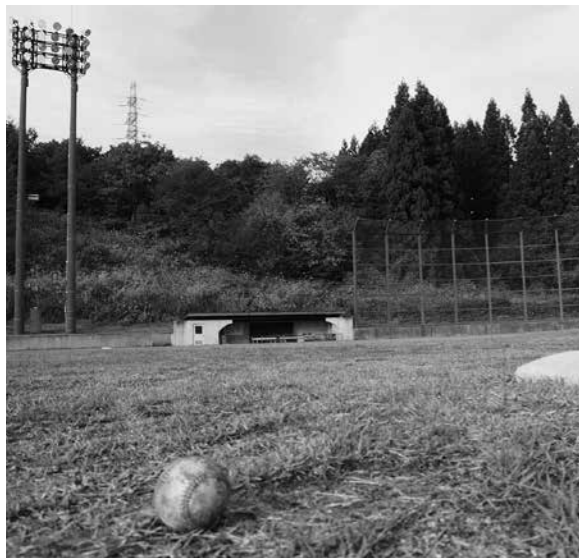
町で一番広く、整備された多目的グラウンド

住民税務課長 たばこの税率が上がったため、本体も値上がりしています。また町内のコンビニ、ホームコンビニでもたばこを販売しており、税収増につながったと判断しています。