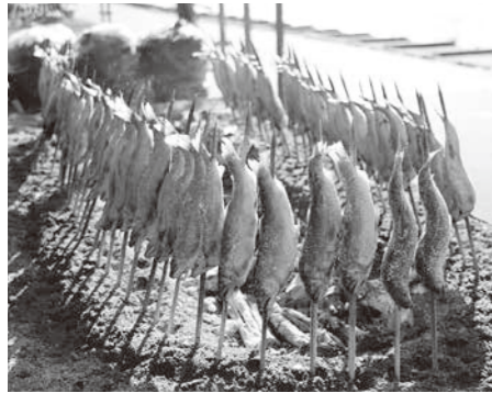
今年も美味しく焼き上がりました

町長 若鮎まつりの趣旨を踏まえながら、今後は実行委員会や出店者の方と協議し、売価の決定をしたいと思います。