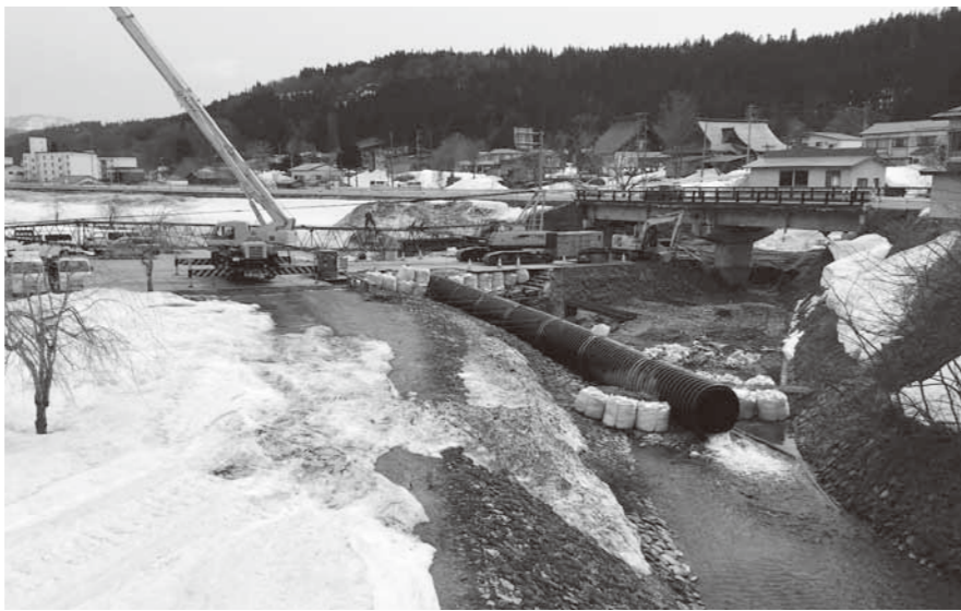
令和4年10月完成に向けて工事が進められている寺下地区

教育課長 これまでは、数学検定は小学5年生と中学2年生、英語検定は中学2年生に対して補助を行なっています。4年度は、これに加えて中学生全員分の英語検定補助をと考えています。