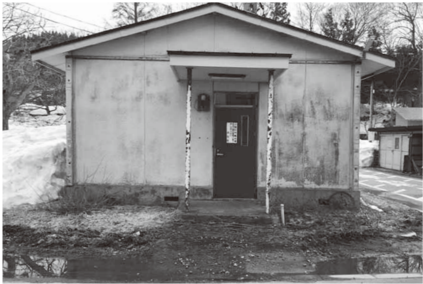
外装も改修が必要な集会所

地域整備課長 改修事業の内容は、エアコン、トイレ、床の改修になっています。また集会所の使用については上司と相談をして、進めていきます。