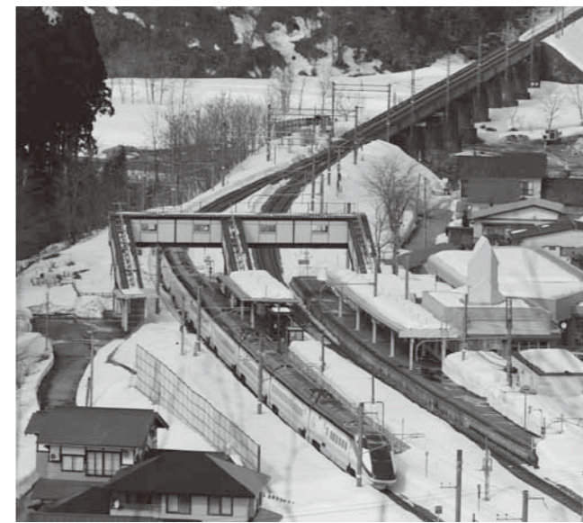
縁結びの道からの景観（舟形駅通過中の新幹線）

町長 提携先と考えているのは、県内旅行会社及び仙台市内の旅行会社を想定しています。若あゆ温泉エリアには、WiFi環境も整備され