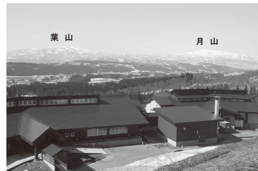
若あゆ温泉から早春の眺望

ており、ワーケーションもPRしながら魅力的でお得なプランをプレゼンしていく考えです。また、インターネットからの予約が多いことから国内大手宿泊予約サイトの「じやらんnet」と4月からの提携を検討しています。新たな観光コースの開拓の必要性については、