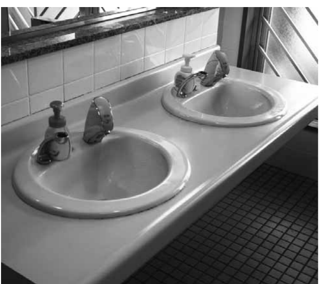
自動手洗いでコロナ感染対策に期待

議員 放課後児童対策事業で環境整備の内容は。 教育課長 消毒液等の消耗品と手洗い場の蛇口5か所の自動水栓工事で、備品は机4台、椅子10脚です。