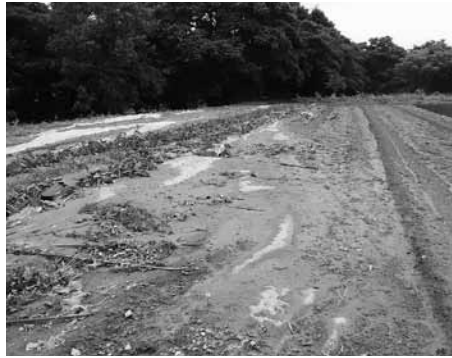
流出したきゅうりのほ場（根渡地内）

農業振興課長 産地支援としては、冠水した農地等への追加防除薬剤と、きゅうりのほ場で川に流出した支柱の購入費で、被災農業者支援は、流出した水稲の育苗ハウスの復旧と農業用機械が浸水で破損し、再度購入や修繕した方への支援です。