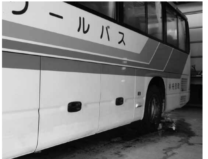
トランクルームが大きくなるスクールバス（写真は現行車）

デジタルファースト推進室長 国の予算配分は、1000世帯から3000世帯で1100万円が標準であるため町でもこの金額を予算計上したが、最終清算の結果減額となりました。