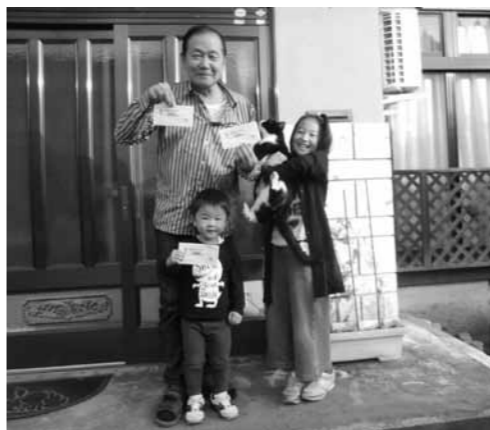
「元気にくらしましょう品券」でがんばってくらしましょう

まちづくり課長 この商品券は、町の商工会に加盟する商店等で使用することができます。交付時期は、11月上旬を目途にしています。