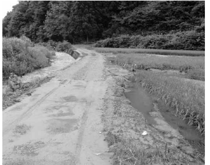
松橋川から町道を越流し農地が冠水（真木野後山線）

福祉避難所施設整備事業、防災拠点施設整備事業等により、地方債残高比率の上昇は免れません。第7次舟形町総合発展計画に掲げた数値目標の達成に向け、行政は健全な執行に、議会は確かな審議に専心していただきたい。