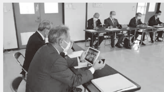
今後タブレットを使用したウェブ会議を実施するための研修