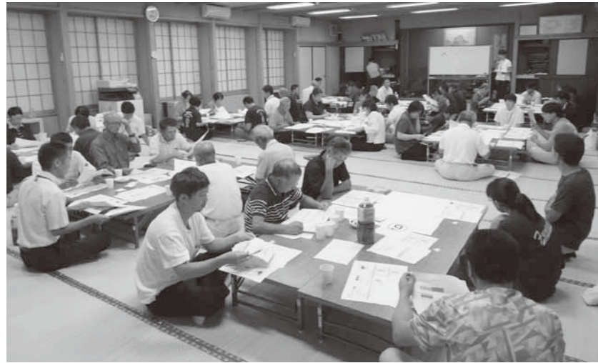
地域運営組織構築に向けて真剣なワークショップが行われました

質問 最終年度の進め方と達成目標は。 町長 地区連合町内会を中心に、地域運営組織の構築に向けた検討を具体的に進めていきます。達成目標は、旧小学校区における4つの地域運営組織の構築です。