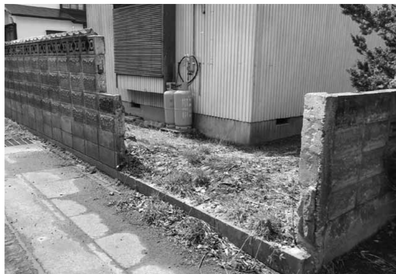
レベル3に該当するブロック塀

※レベル1…控え壁がない場合(1.2m以下は除く) ※レベル2…笠木の損傷及び基礎がない場合 ※レベル3…ひび割れ、傾き、損傷がある場合