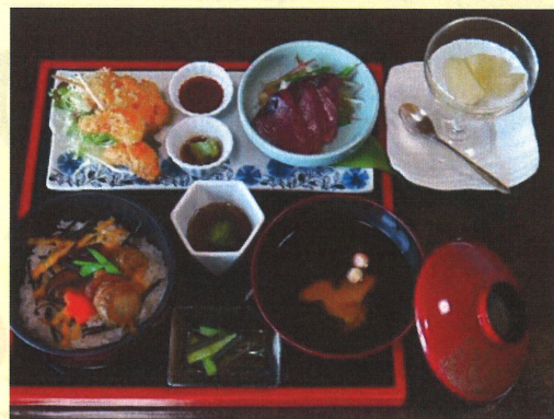
初夏の膳 ※写真はイメージです。