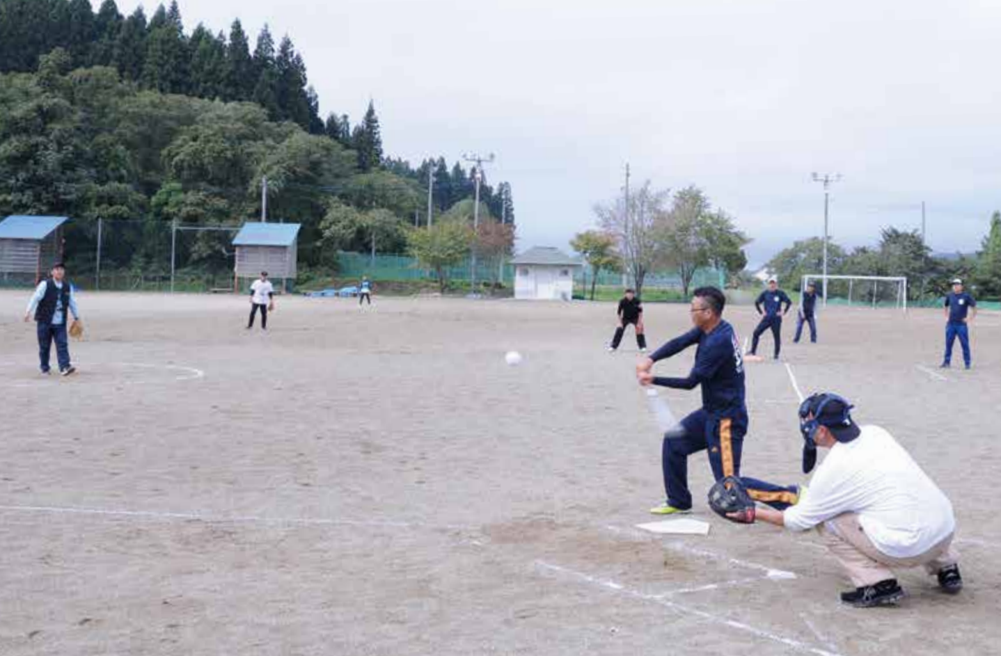
舟形町スポーツフェスティバル(町内各地)