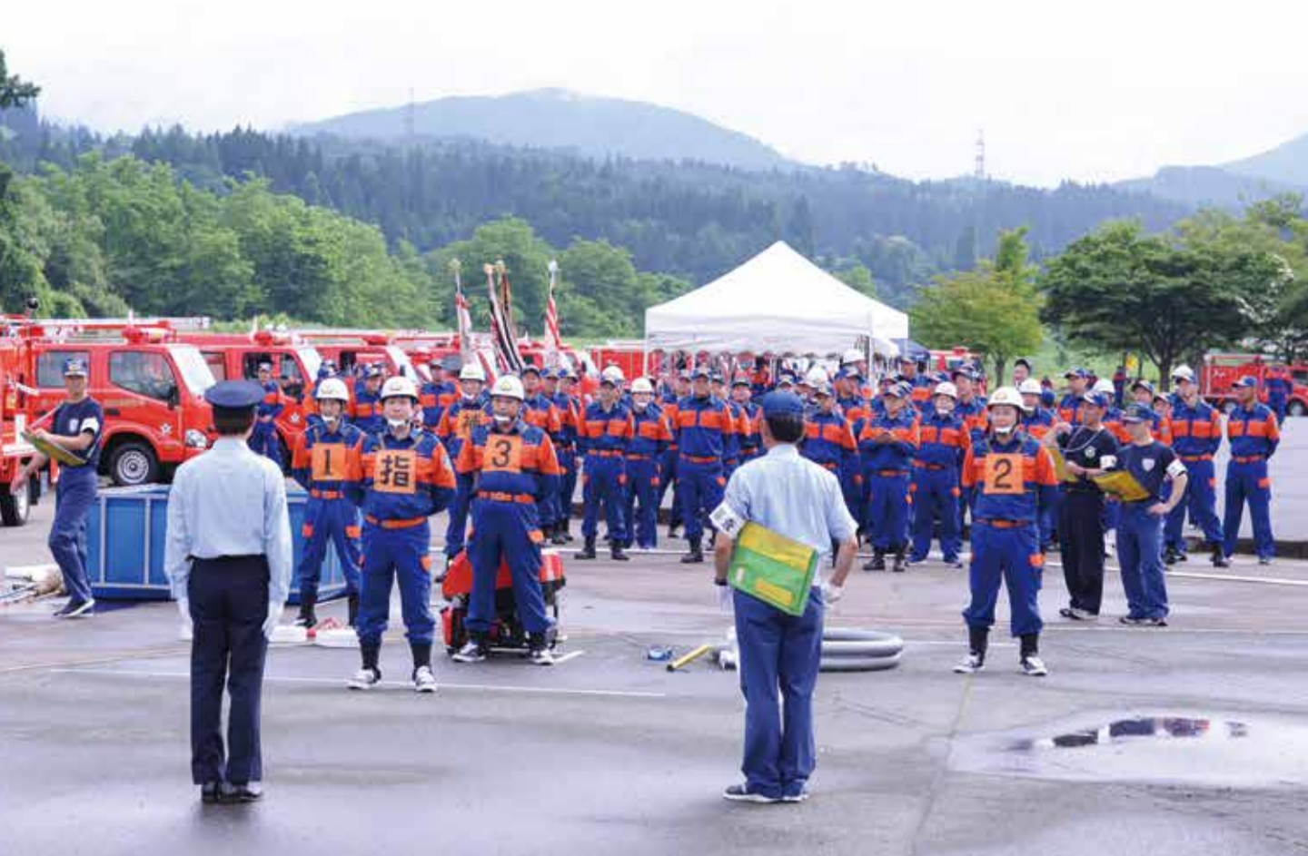
舟形町消防ポンプ操作法審査会（アユパーク）