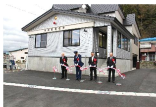
平成27年(2015年) 新・舟形町駐在所が完成。