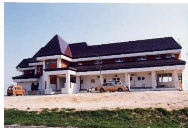
昭和60年(1985年) 舟形町農林漁業体験実習館オープン。