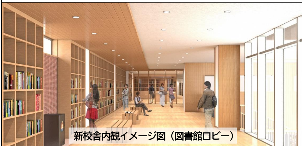
新校舎内観イメージ図(図書館ロビー)

県では、将来の日本をけん引する農林業経営者を養成するため、「東北農林専門職大学(仮称)」の開学準備を進めています。農業・森林業の生産や経営、加工、販売等の知識と理論に裏付けられた技術を、講義だけでなく、県内外の先進経営体での長期実習など豊富な実習で学べる新しいタイプの大学です。県立農林大学校(新庄市)の敷地に校舎を新築中で、現在の高校2年生が第1期生となります。