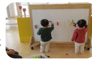
表紙の答え「西川町」