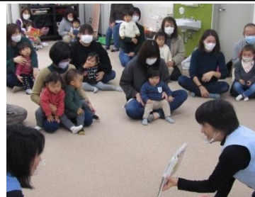
さあ、楽しいお話のはじまり～

第6回ふれあい育児の広場では、かやのみ会の方から読み聞かせをしていただきました。いろいろな絵本の読み聞かせのほか、手遊びや歌に合わせて体を動かすなど、楽しい時間を過ごしました。