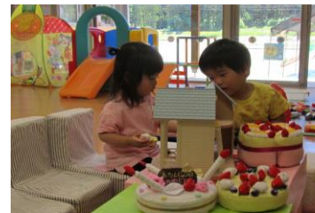
「ピンポン」「おじゃまします」

お友だちがセンターに遊びに来てくれました。はじめは、それぞれ遊んでいましたが、ほかのお友だちが気になって、いつの間にか一緒におうちごっこのようになりました。ケーキもたくさんあってパーティーのようでした。