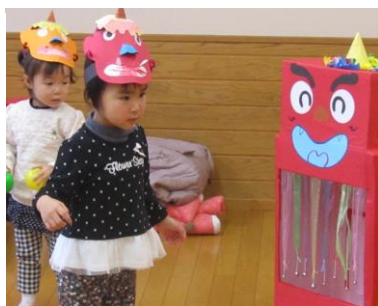
「鬼は外～、福は内～」 鬼さん退治できたかな。 (ふれあい育児の広場より)