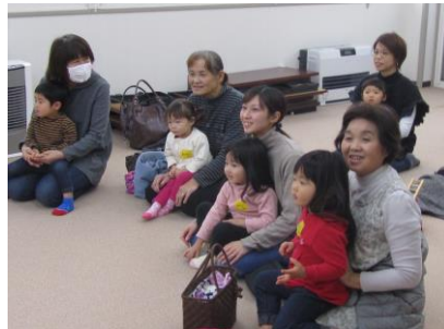
楽しい読み聞かせの時間に子どもも大人も引き込まれました。 (ふれあい育児の広場より)

今年も子育て中のたくさんの方が、支援センターに遊びに来てくれました。新しい年も多くの出会いや、子どもたちの成長を、みなさんと一緒に楽しんでいきたいと思ひます。どうぞよろしくお願ひします。