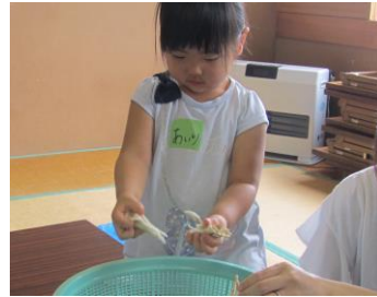
きのこをちぎって、芋煮作りのお手伝い。上手にできました。(ふれあい育児の広場より)

子どもたちと一緒に買い物に行った時には、旬の魚を真近で見て、魚を選ぶのも楽しいですよ。魚に関心を持ってもらい、いろいろな魚も食べられるようにしていきたいですね。