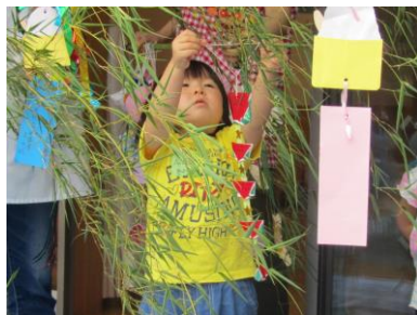
短冊に書いたお願い、かなうといいね。 (ふれあい広場より)

子どもは自分で衣服を調節したり、暑さを言葉でうまく訴えたりすることができません。汗をたくさんかくこの時期は、汗を吸いやすく、乾きやすい下着や、通気性の良い衣服を選ぶと、暑い夏でも快適で、楽しく遊ぶことができますでしょう。