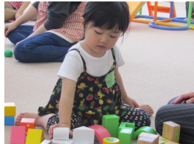
たくさんの積み木で何を作ろうかな (ふれあい育児の広場より)

この時期は暑さで食欲がなくなったり、疲れやすくなったりと体調をくずしやすくなりがちです。子どもは体温調節がまだ未熟なため、水分補給と休息を上手に取り入れ、元気に楽しい夏を過ごしていきましょう。