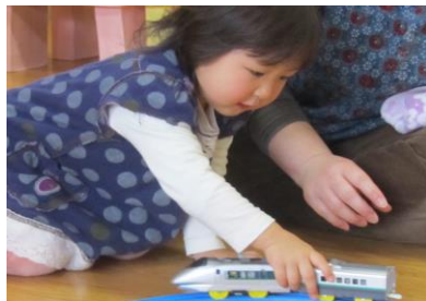
新幹線が通ります。「ガタン、ゴトン」 (交流広場より)

ゴールデンウィークは、長いお休みとなります。新年度の疲れが出やすい時期ですので、お出掛けは無理のないスケジュールを立てましょう。