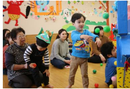
福はうち・鬼はそと～！ 弱虫鬼さん、逃げて行ったね！ (ふれあい育児の広場より)