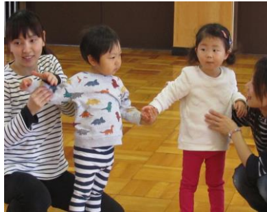
リズムに合わせて、 仲良く体を動かしました。 (ふれあい育児の広場より)