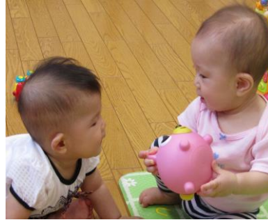
同級生だね。 お友達になりましょう。 (交流広場より)

8 月は豪雨による甚大な被害が、町内のあちこちでありました。お米の収穫時期は、良い天候に恵まれてほしいと願うばかりです。