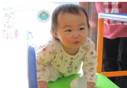
すべり台の階段も、ひとりで 上れるようになったよ。 (交流広場より)

天候の変化が激しい季節の変わり目 は、体のバランスを崩してしまいがち です。こまめに子どもの様子を観察しな がら、ゆったりと過ごせる時間をつく り、体調に配慮していきましょう。