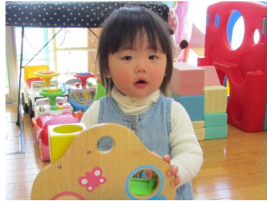
ボールがコロコロ…楽しいね。 いっぱい遊べたね！ (交流広場より)