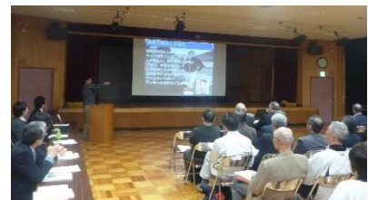
昨年の報告会の様子

▼問い合わせ／舟形町まちづくり課地域支援係 ☎ (32) 2111（内線356）