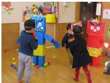
福はうち・鬼はそと～！ 弱虫鬼さん、逃げて行ったね！ (ふれあい育児の広場より)