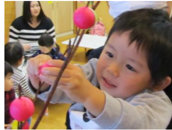
水木団子かざり きれいに上手にかざれたね (ふれあい育児の広場より)

寒さの厳しい季節ですが、かぜは万病のもと、予防に努めましょう。体を冷やさない、疲れをためない、しっかり食べる…など日頃から体調管理を大切に、うがいと手洗いを習慣づけましょう。手洗いは腕まで丁寧に洗うことがポイントです。