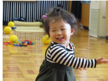
3B体操。リズムに乗って楽しく遊べました! (ふれあい育児の広場より)