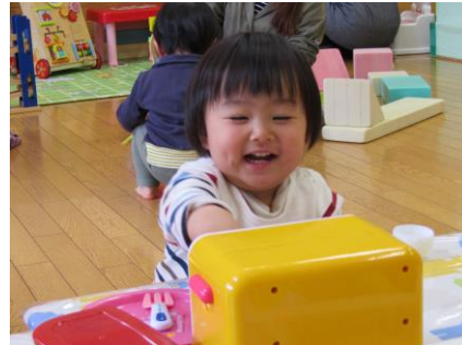
「チーン」アツアツのお料理完成。 みなさん、どうぞ召し上がれ!! (交流広場より)

田植えの時期から梅雨にかけては、気温の変動も大きく体調を崩しやすくなります。湿度も高く食中毒などの心配もありますね。体調管理に努め、疲れをためないよう心がけましょう。