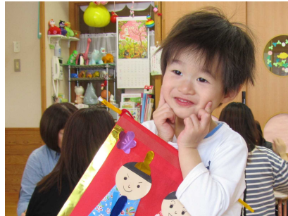
おひな様の壁飾りを作りました。 お内裏様と僕、どっちがかわいい? (ふれあい育児の広場)

「みらい」では、4月から新しいスタッフ体制で、みなさんのお越しをお待ちしています。親子のふれあいの場として、お気軽にお立ち寄りください。