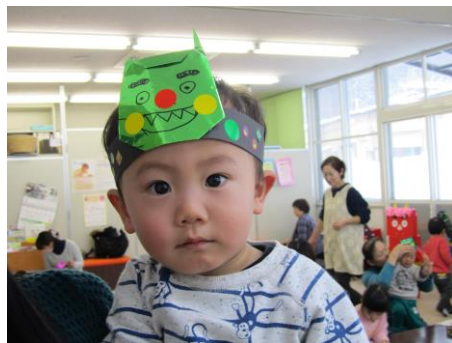
「鬼は外～！福は内～！」 心の中にある鬼を退治できました♪ (ふれあい育児の広場より)