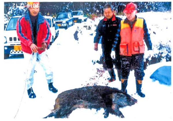
捕獲したイノシシ(成獣オス) 体長約150cm 体重約80kg (平成28年12月12日 経檀原地内)