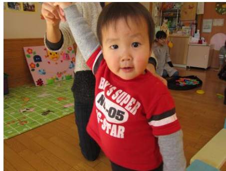
ソフト積み木で長〜い道を作ったよ。 やったあ、僕も上手に渡れたよ〜。 (交流広場より)

先日の積雪で、町中「白い世界」となりました。寒さがひとしお身にしみて、本格的な冬の到来です。寒い日が続きますが、慌ただしい師走を健康に過ごしましょう。