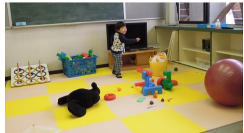
キッズルームの様子