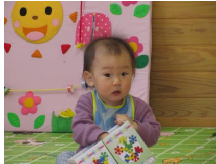
箱の中からはなにが出てくるのかな？ ほくね、このブロックがお気に入り♪ (交流広場より)

センターでは色々な遊びや子育てのヒントを沢山ポケットに詰め込んで、みなさんのお越しをお待ちしています。