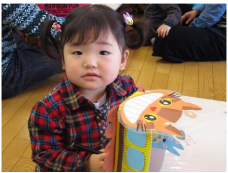
トトロのネコバス ママと一緒に作ったよ。 トトロだ〜いき！ (ふれあい育児の広場より)

たくさんの笑顔がみられますように。新しいお友達との出逢いを楽しみに待っています。