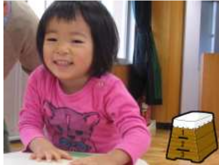
キッズ体操 跳び箱にのぼって上から ジャ〜ンプ!! やったー! (ふれあい育児の広場より)

この一年、ヨーロッパのテロ事件をは じめとして、国内外で暗いニュースが目 立ちました。新しい年は「さる年」にち なみ、いろいろな災いが去り、平和で明 るい話題が多くなってほしいと心から 願っています。