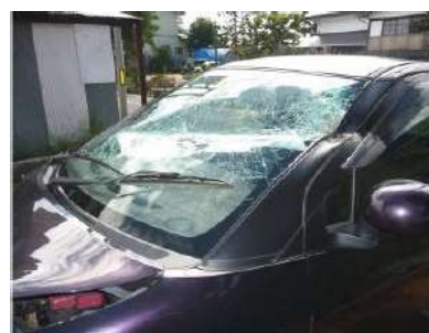
倒木が直撃し、破損した車両

※管理が適切に行われなかったことにより事故が発生した場合、樹木の所有者等は責任を問われることがあります。