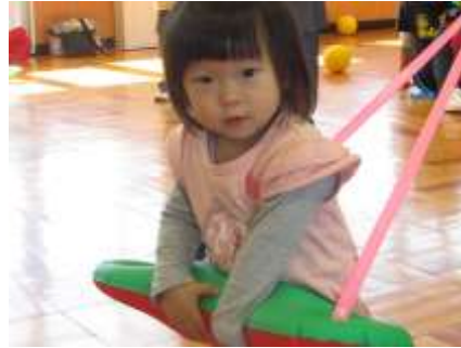
3B体操。 電車ごっこ！わたし運転手さんだよ。 発車、オーライ！！ (ふれあい育児の広場より)

冷凍食品などの普及でいつでも食べられます。この時期“カボチャを食べて風邪知らず”になりましょう。