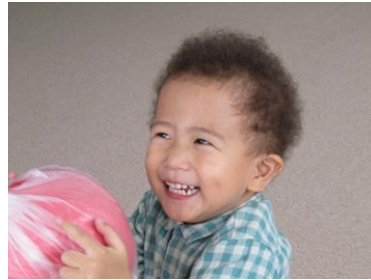
ゆらゆら揺れるボール。上手にキャッチできるかな。「やったー！つかまえた！」 (ふれあい育児の広場より)

背の青い魚は、血圧を下げる作用や体を温める働きがあるといわれています。これから旬を迎えるサンマやイワシ、サバなどの魚は、生活習慣病の予防のためにもお勧めです。