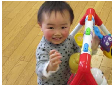
カメラを向けられると ちょっと照れちゃうなあ！！ (遊びの広場より)

立春を過ぎ、暦の上ではもう春ですが、まだまだ寒い日々が続きます。暖かい春の日差しが待ち遠しい、今日この頃です。